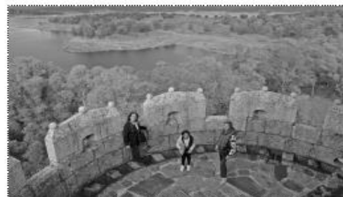
Embalse Gabriel y Galán, Granadilla.