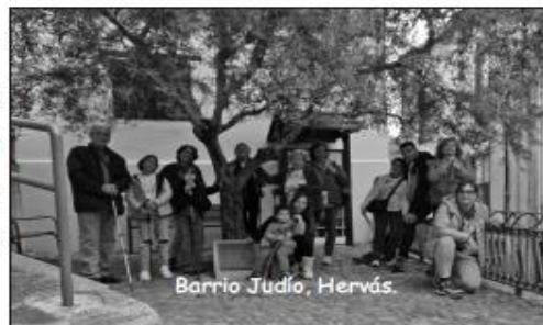
Barrio Judío, Hervás.