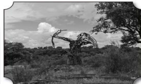
La Serrana de la Vera